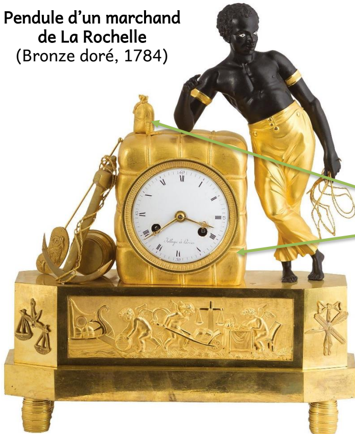
Pendule d'un marchand de La Rochelle (Bronze doré, 1784)

A partir de cette pendule, j'observe et j'émet des hypothèses pour décrire les activités d'un marchand de La Rochelle.